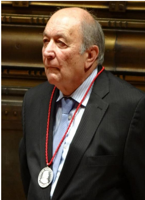
Никола Попов награден с медал Моцарт 2013г.

Една петдесет и четири годишна траектория от живота на Никола Попов (1935) преминава извън рамките на родината. Радетел на българската контрабасова школа, пропътува и пренася наученото в София през Балканите до Близкия Изток, и стига до Латинска Америка. Основател на съвременната контрабасова школа в Мексико, изгражда десетки поколения мексикански контрабасисти. Това е най-кратката характеристика, която бих дала за Никола Попов.