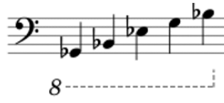
Виенски строй - соло скордатура